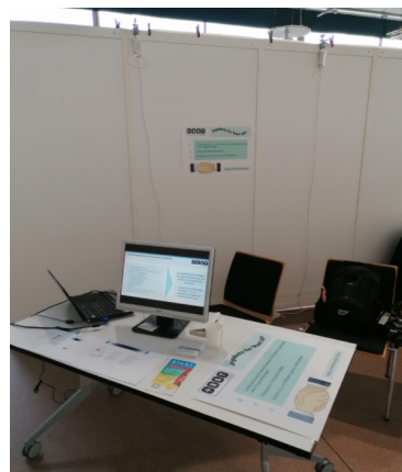
Unser Stand von MitRat&Tat direkt bei der Forumsbühne